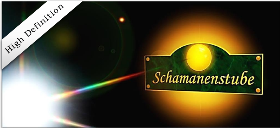
Aus der Steinzeit zum HD TV – schöne neue scharfe Welt