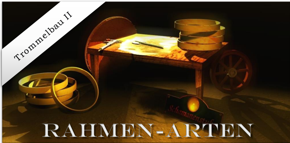
Der Holzrahmen einer Schamanentrommel – rund oder eckig, gross oder klein, tief oder kurz