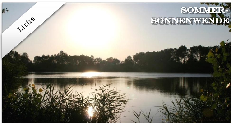
Die Schamanenstube entzündet die Erdfeuer und lässt sie den Feuern der Sonne begegnen.