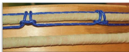
Äussere Spannringe der Schamanentrommel

Bevor man eine Schamanentrommel spannen kann, darf alles parat liegen. Die beiden Ringe, die über den Holzrahmen kommen, kann man aus verschiedenen Materialien herstellen. Es gibt die Möglichkeit von Stromkabeln, von Drahtseilen oder Naturseilen. Wir empfehlen den Draht. Denn zu diesem Zeitpunkt kann man sich kaum vorstellen, welche gewaltige Kräfte man in die Trommeln noch reinsteckt.