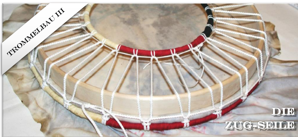
Teil III: Schamanen-Trommelbau. Wie wird eine Trommel spannbar?