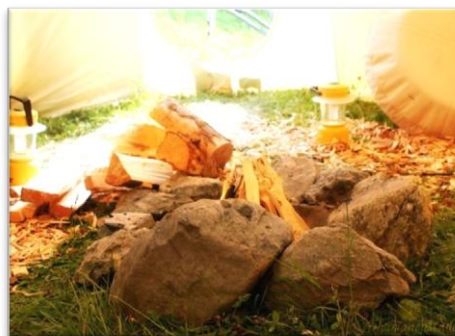
Die Erd-Flammen züngeln in den heiligen Kreis

Für das Basislager entscheiden wir uns für die vermehrte Verwendung von Holzkohle, damit auch Tipi-Unerfahrene nicht im Holzrauch ersticken. So wird aus dem ersten Feuer für die Räucherung des Tipis bald ein tief aus der Erde loderndes Erdfeuer.