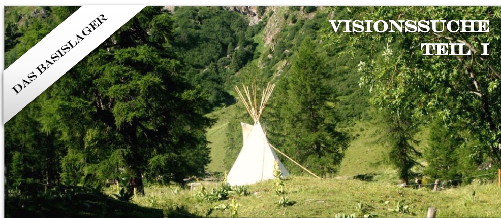
Visionssuche Teil I: Der Auftakt der Visionssuchen-Wochen in Graubünden – das Basislager