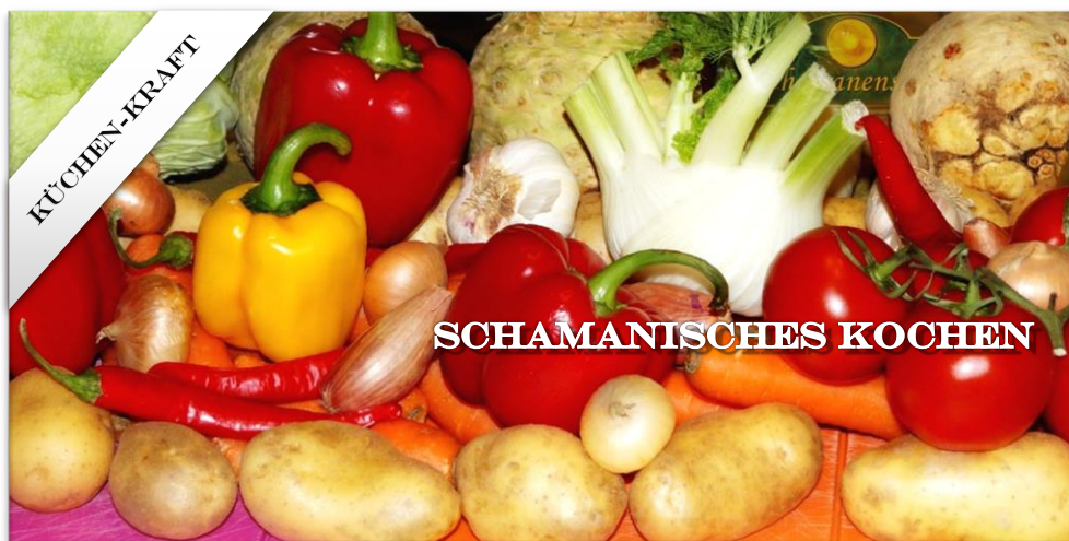
Die emotionale Art des Kochens – das Nutzen der Kraftbewegung von Lebensmitteln